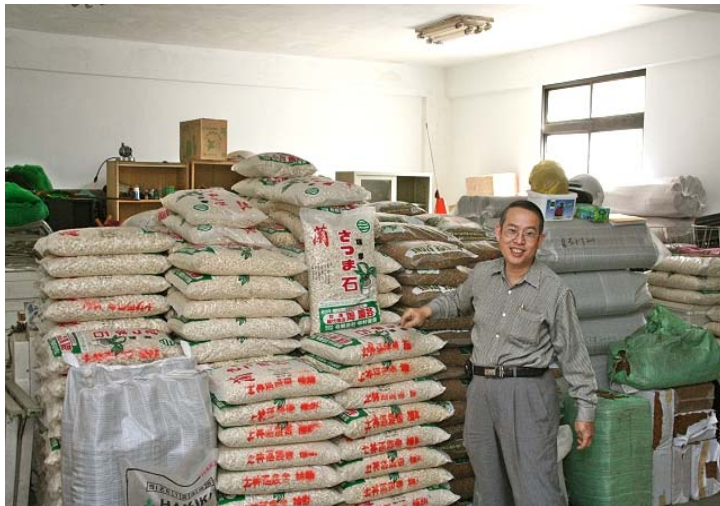
蘭花專用的培養土，堆滿整座倉庫>