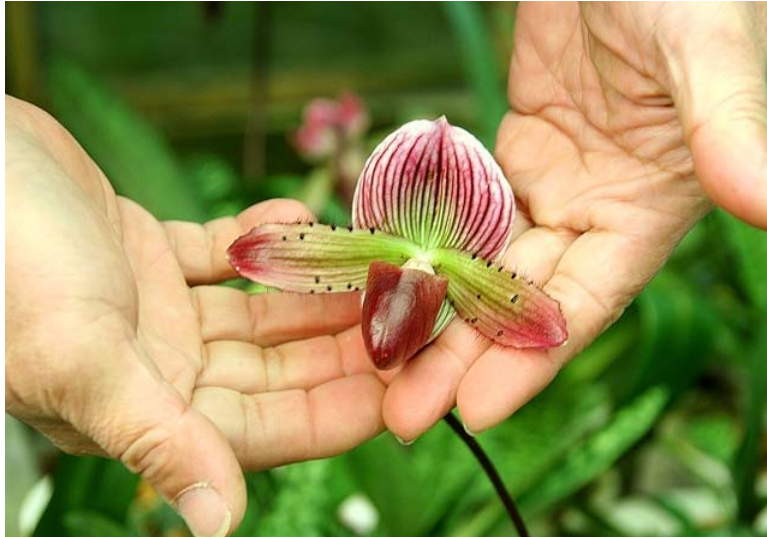
「台灣春蘭園」位於風景秀麗的草山，栽培千種以上的蘭花，圖為「拖鞋蘭」