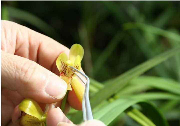
徐醫師表示，蘭花特有的唇瓣，特別適合授粉，也造就蘭花旺盛的繁殖力